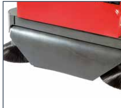
CONVOYEUR DE POUSSIÈRE STAUBSCHÜRZE EXTRA ANTI-STOFKAP AAN DE VOORZIJD