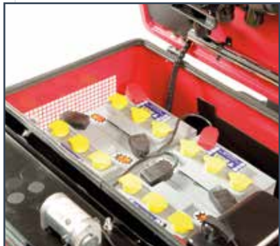
6 BATTERIES 6V-270 Ah (20h) - (E) 6 BATTERIEN 6 V-270 Ah (20h) - (E) 6 BATTERIJEN 6 V-270 Ah (20h) - (E)