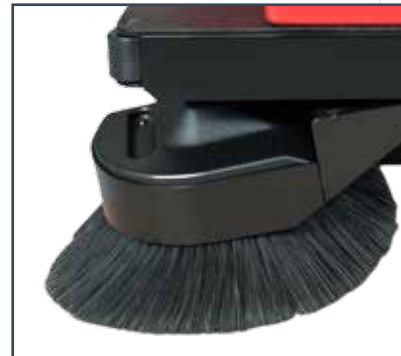
BALAI LATERAL GAUCHE LINKER SEITENBESEN ZIJBORSTEL AAN LINKER VOORZIJD