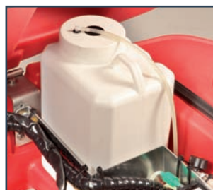
DOSATORE DETERGENTE ON BOARD DOSIFICACIÓN DETERGENTE A BORDO DOSEUR DE DETERGENT INCORPORE