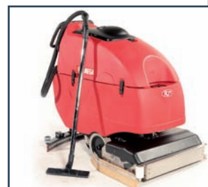
LANCIA LAVAGGIO-ASCIUGATURA LANZA FREGADORA-SECADORA LANCE DE LAVAGE-SECHAGE