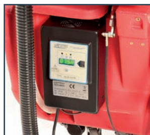
CARICA BATTERIE ON BOARD CARGADOR DE BATERÍA INCORPORADO CHARGEUR DE BATTERIES INCORPORE